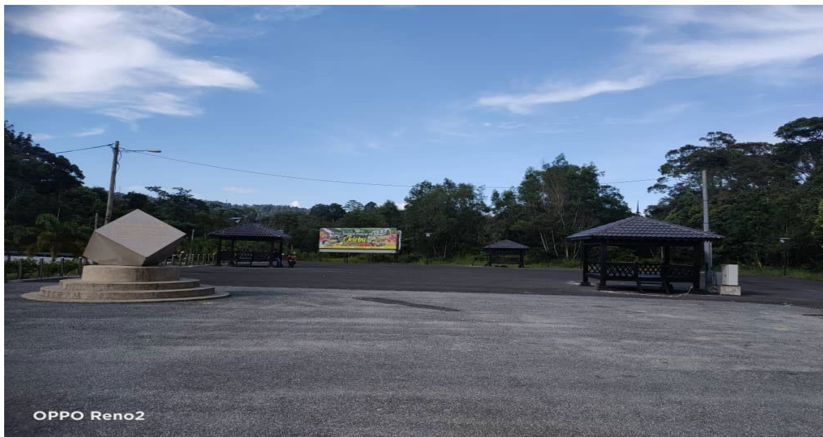
LOKASI DATARAN BUKIT TANGGA