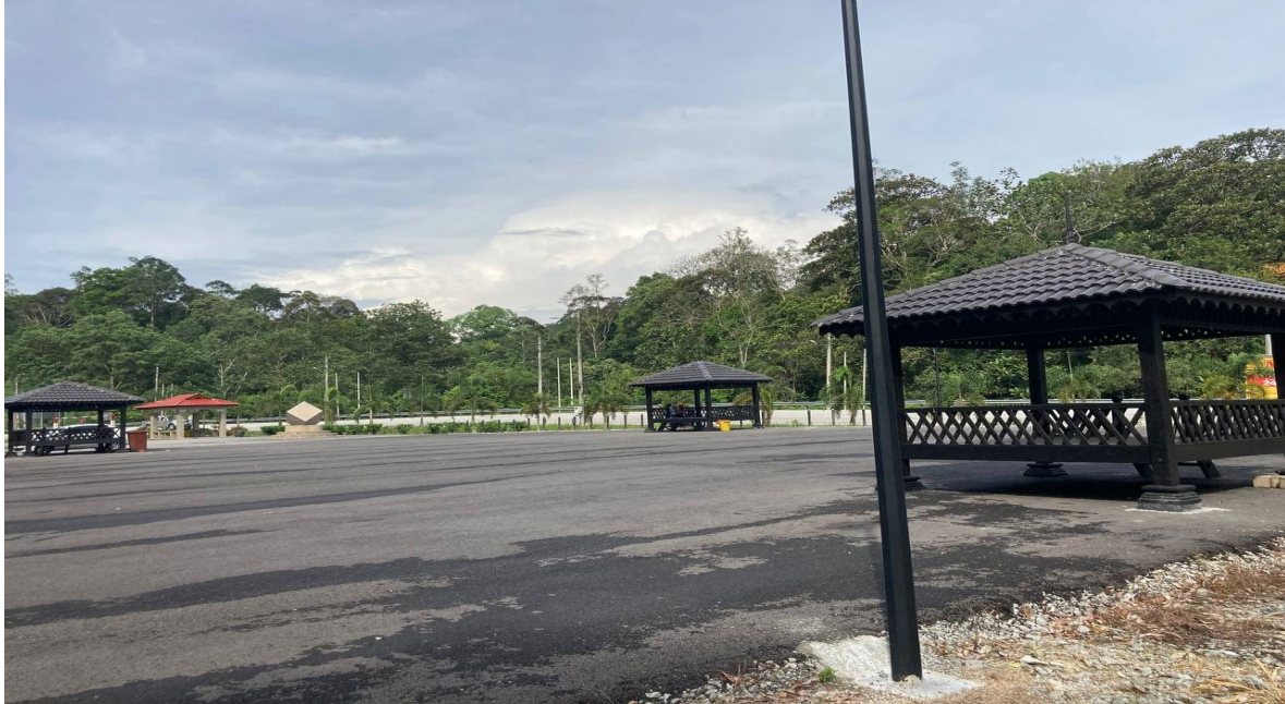
LOKASI DATARAN BUKIT TANGGA