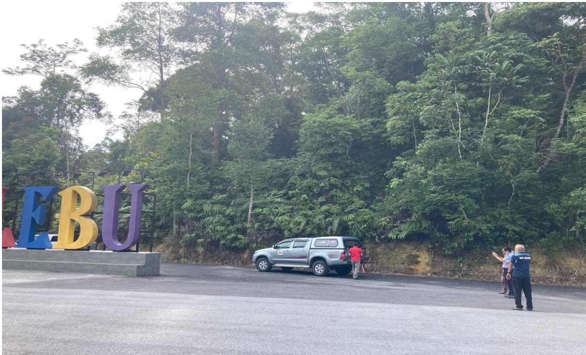
LOKASI DATARAN BUKIT TANGGA